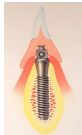
Visione dell'aggancio dentiera con radice artificiale

La protesi diventa così fissa che permette di mangiare in modo naturale. Sarà persino possibile addentare una mela od un panino, operazioni prima impensabili. Anche la fonetica sarà sicuramente migliorata, dando al paziente, una maggiore sicurezza psicologica. A fine giornata la protesi non ha bisogno di difficili operazioni igieniche, ma potrà essere pulita con un normale spazzolino e dentifricio.